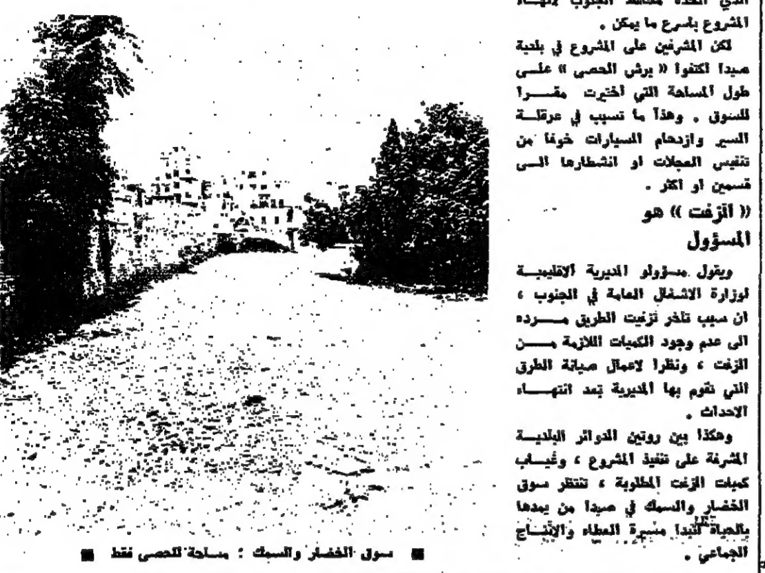
سوق الخضار والسكك : مصادمة للكمسي فقط

صيدا - « الانوار » : سوق الخضار والسكك التي كان مقرها ان تنتهي في نهاية ايلول الماضي ، توقف العمل فيها ، رغم القرار الذي اتخذته محافظة الجنوب لانهاء المشروع بأسرع ما يمكن . لكن المترجمين على المشروع في بلدية صيدا اكتفوا « برش الحصى » على طول السككة التي اخذت مقراً للسكك . وهذا ما تسبب في عرقلة السير وازدحام السيارات خوفاً من تفتيس العميلات او انتشارها الى شمس او اكثر . « أترقت » هو المسؤول